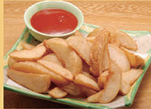
ポテトフライ 380円 (税込418円)