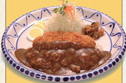
ロースかつカレー 1,180円 (税込1,298円)