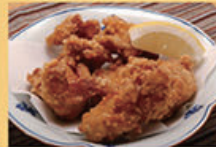
鶏唐揚げ 480円 (税込528円)