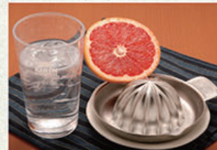
生搾りグレープフルーツサワー 550円 (税込605円)