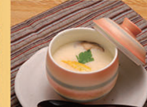
茶碗蒸し 310円 (税込341円)

ご飯 200円 (税込220円) 白米・ 十六穀米 二選べます (注) 十六穀米は 品切れする ことがあります。