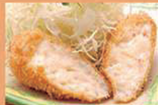
手作り蟹クリームコロッケ