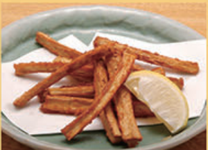
ごぼろ唐揚げ 480円 (税込528円)

ご飯 200円 (税込220円) 白米・ 十六穀米 二選べます (注) 十六穀米は 品切れする ことがあります。