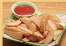
ポテトフライ 380円 (税込418円)