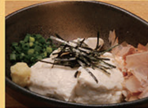
寄せ豆腐 380円 (税込418円)