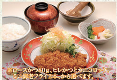
お子様かつ定食 880円 (税込968円) ※ロースかつ80g、ヒレかつとカニコロケ、ミニ海老フライ2本、から遣べます。