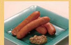
ピリ辛ソーセージ 480円 (税込528円)