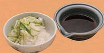
ネギ&おろしセット