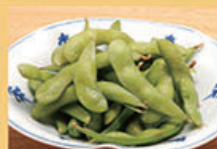
枝豆 380円 (税込418円)