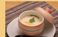
茶碗蒸し 310円 (税込341円)