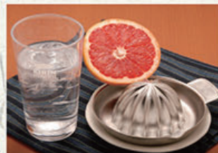
生搾りグレープフルーツサワー 550円 (税込605円)