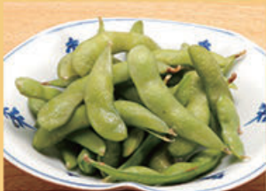
枝豆 380円 (税込418円)