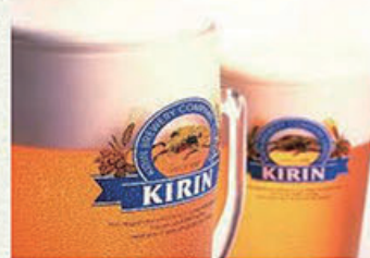
ひとつくち生ビール . . . . . 300円 キリン一番搾り (税込330円)