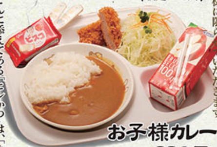
お子様カレー 680円 (税込748円)