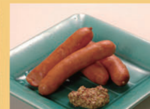
ピリ辛ソーセージ 480円 (税込528円)