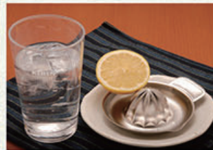
生搾りレモンサワー 550円 (税込605円)