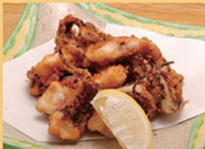
げそ唐揚げ 480円 (税込528円)