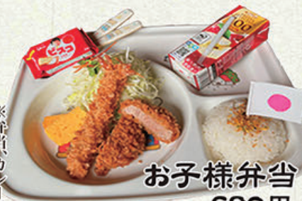
お子様弁当 680円 (税込748円)

※弁当「カレー」、うどんに添えてある「ヒレかつ」は、「カニコロケ」に変更できます。