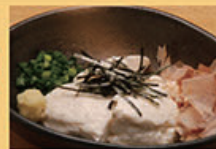
寄せ豆腐 380円 (税込418円)