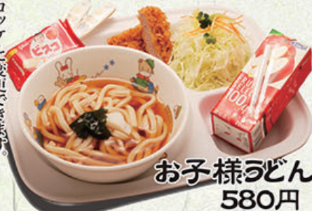
お子様うどん 580円 (税込638円)