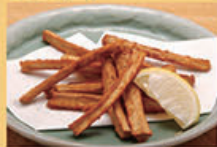
ごほう唐揚げ 480円 (税込528円)