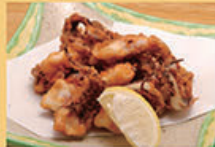
げそ唐揚げ 480円 (税込528円)