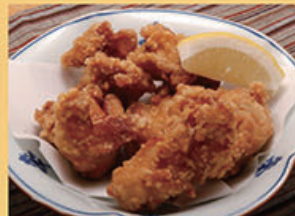
鶏唐揚げ 480円 (税込528円)